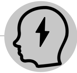
Dor de cabeça