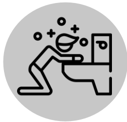
Náusea e vômito