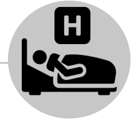
Coma ya boongo

Bato mingi oyo bazali na WNV bakomonisa bilembo ya maladi te. Bato moke oyo bazali na WNV bazali na bilembo ya pete mpe bilembo, oyo ebandaka mikolo 3 kino 15 nsima ya koswa na nyama ngungi oyo ezali na mikrobe. Yango esangisi fievre, mpasi na moto mpe na nzoto, kolemba, mpe kosanza. Bato mingi oyo bazali na bilembo ya makasi te bazongaka malamu, kasi kolemba mpe bolembu ekoki koumela baposo to basanza.