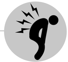
Mpasi na nzoto mpe na misisa