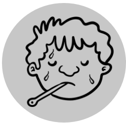
Fefele mpe malili makasi