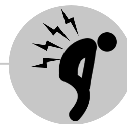
Douleurs dans le corps et les muscles