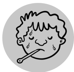
Fièvre et frissons