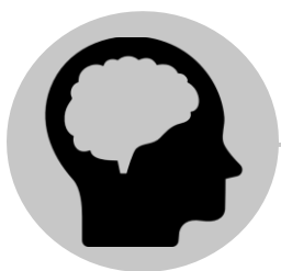
Inflammation du cerveau