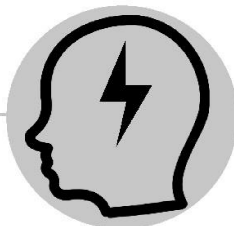
Dor de cabeça