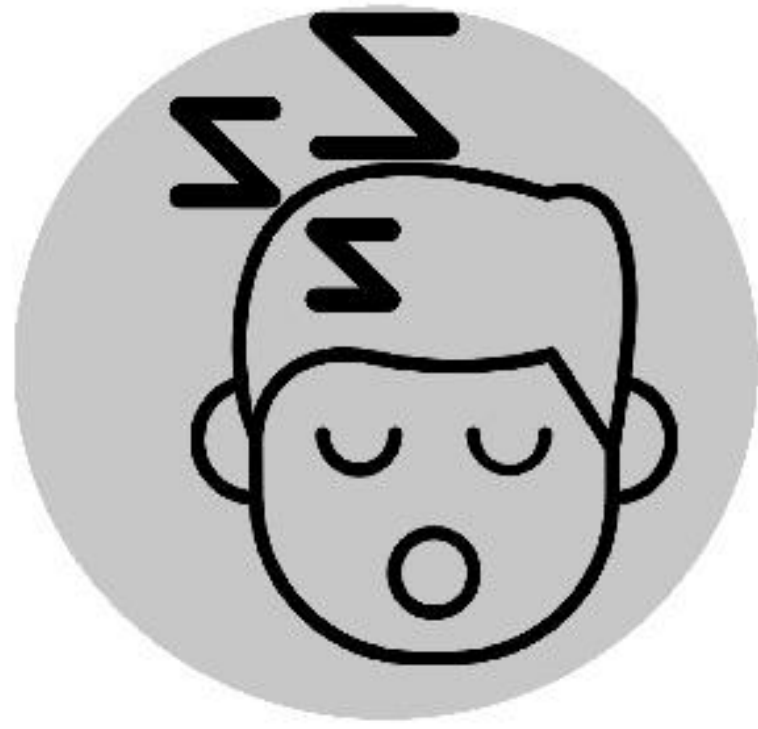
الشعور بتعب شديد