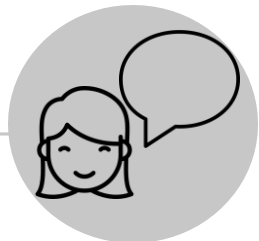
Dificuldades ao falar

Os sinais e sintomas geralmente aparecem uma semana a um mês após a picada por um carrapato infectado. Os sinais e sintomas também podem incluir perda de coordenação motora e convulsões. Muitas pessoas com encefalite de Powassan não apresentam nenhum sintoma. A encefalite de Powassan pode causar inchaço no cérebro e na área circundante. Cerca de metade dos sobreviventes ficam com danos cerebrais permanentes e cerca de 1 a cada 10 casos resulta em morte.