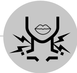
Mpasi na nkingo