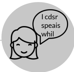
Matatizo ya kuzungumza

Ishara na dalili kawaida huanza wiki moja hadi mwezi mmoja baada ya kuumwa na kupe aliyeambukizwa. Ishara na dalili zinaweza pia kujumuisha kupoteza uratibu na kifafa. Watu wengi wenye Powassan hawana dalili zozote. Powassan inaweza kusababisha uvimbe wa ubongo na eneo jirani. Takriban nusu ya walionusurika wana uharibifu wa kudumu wa ubongo na takriban kisa kimoja kati ya kila kumi huishia katika kifo.