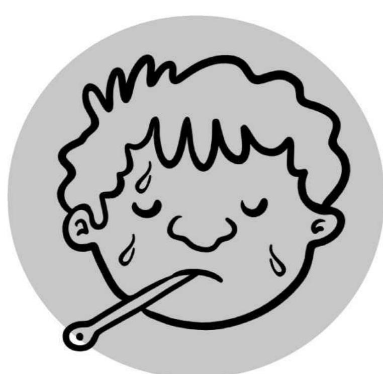
Fievre ya makasi mpe kolenga