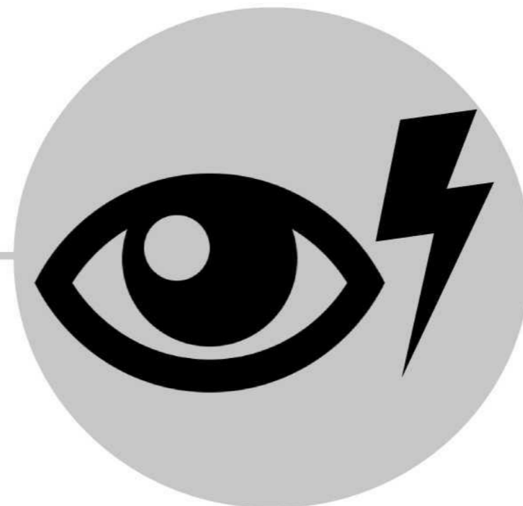
Ka cabsashada iftiinka (Indhaha oo ka falceliya iftiinka)