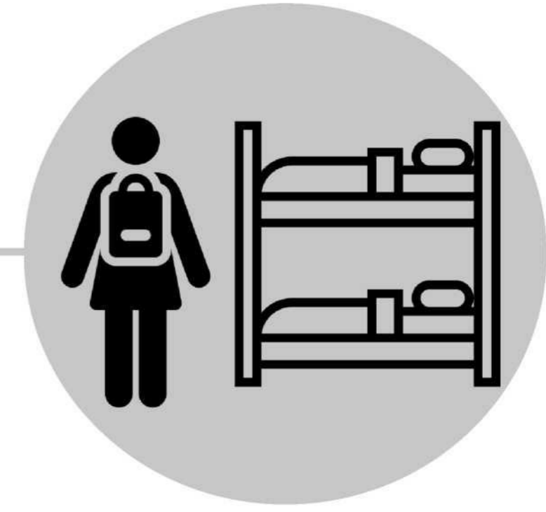
Ardayda Kulliyada ee kuwada Nool Qol-jiifka

Dadka kale ee halista ugu jira waxaa ka mid ah dadka leh xaalado caafimaad oo u safra dalalka ka hooseeya Saxaaraha Afrika.