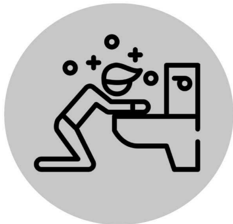
Yalaalugo iyo Matag