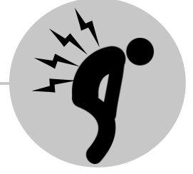
Jir iyo Murqo Xanuun