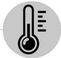
Fievre ya makasi te

Eloko moko ya mpembe to ya gris ezipamaka na ba amygdales, na mongongo to na zolo. Bilembo misusu ezali kokauka ya mongongo, kosukosu ya koganga, mpe makwanza ya mposo. Maladi ya makasi ekoki kozala na kovimba ya nkingo, motema ezobeta na ndenge ya malamumu te, to paralysie.