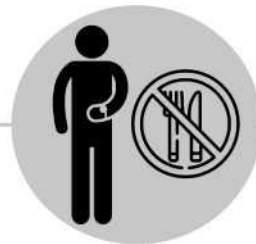
Kobungisa mposa ya kolya